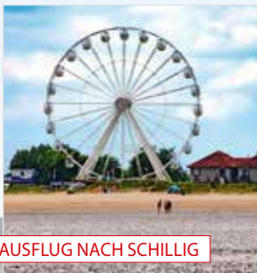
AUSFLUG NACH SCHILLIG