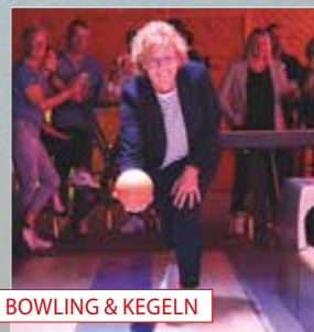
BOWLING & KEGELN