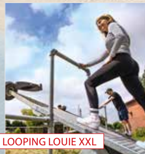
LOOPING LOUIE XXL